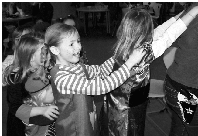
...hier fliegen gleich die Löcher aus dem Käse...