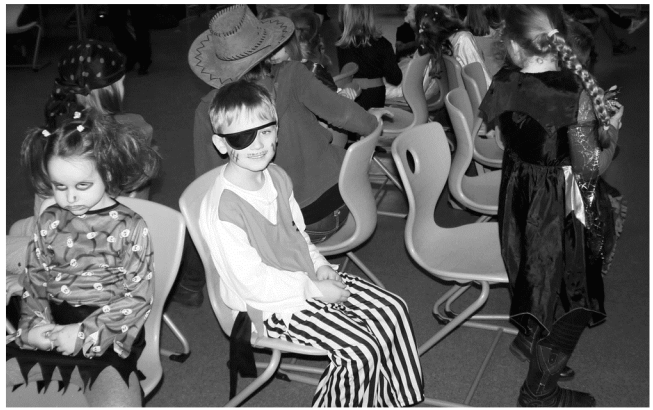
Der Klassiker: Stuhltanz

Es hat sich gezeigt, dass die Aula der Schule ein idealer Veranstaltungsort für die Veranstaltung ist, vielleicht im nächsten Jahr wieder – bei noch mehr Beteiligung?