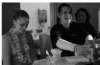
..die fleißigen Helfer am Werk...